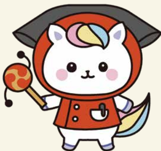
看護ちゃん 岐阜県 Ver.