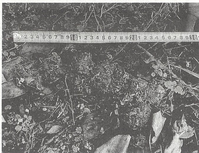
クマのフンは、食べたものがほとんどそのまま出るのが特徴で、いわゆる排泄物のおいしはほとんどありません。（写真は柿を食べたクマのフン）。