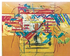
満ちた一つの歌 (1995年)