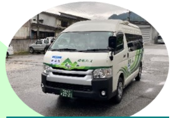
山之村線運行車両

令和5年4月の改正により、バスで山之村牧場へ行くことができるようになりました！ ひだまる山之村線車内で山之村牧場で利用できるクーポン券を配布しています！