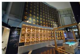
ひだ宇宙科学館カミオカラボ

●道の駅スカイドーム・カミオカラボバス停： 道の駅スカイドームに併設されている宇宙物理学研究を紹介する「ひだ宇宙科学館カミオカラボ」がおススメ！館内には大型スクリーンでの映像鑑賞やミニゲームにより宇宙物理学に触れられます。