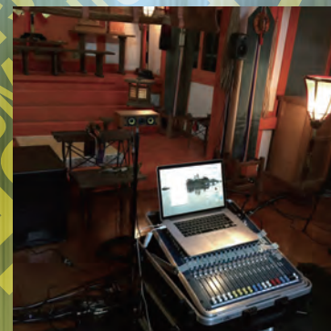
アコースモニウム 神社コンサート (奈良)