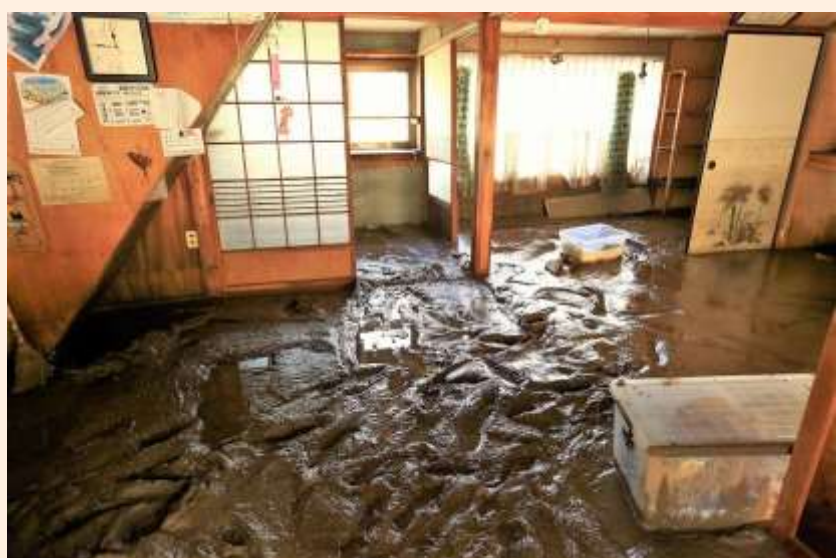
関市上之保地区