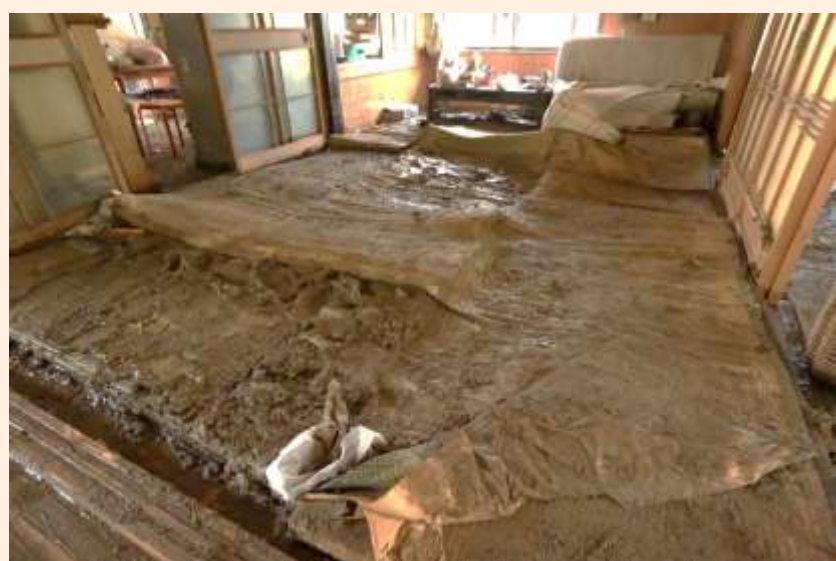
関市上之保地区