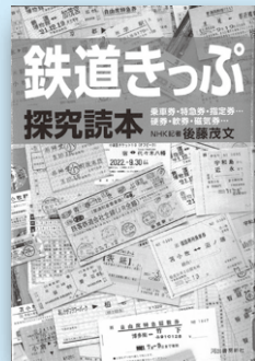
『鉄道きっぷ探究読本』 後藤茂文/著 河出書房新社

きっぷの種類や歴史、未来を徹底解説！ICカードの利用が増えていますが、きっぷの持つ魅力の再発見ができました。