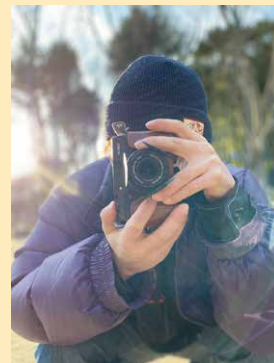
『暖かな日差し、温かな町。』 古川町 (古川町 ひだまるさん)