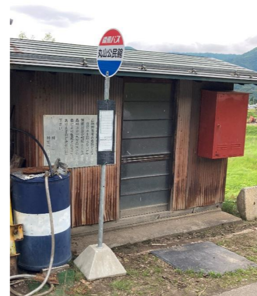
【写真②】 ひだまる吉田線 丸山公民館（神岡町丸山地内）