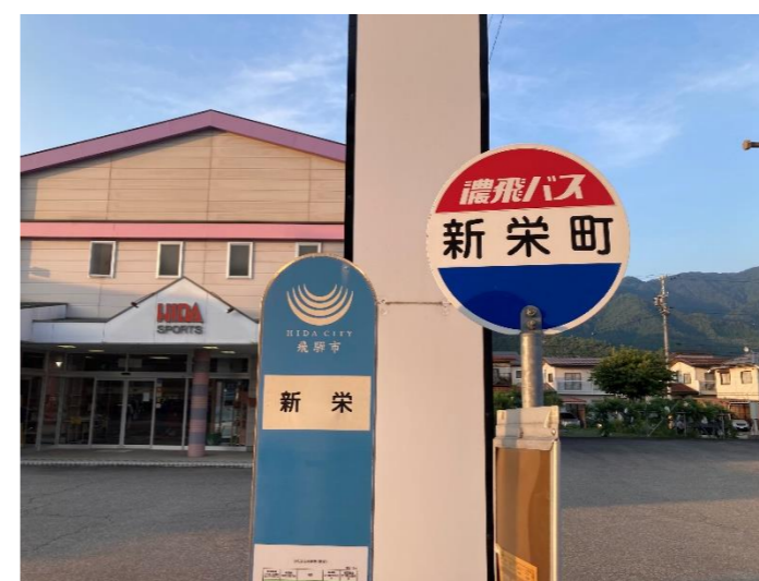
【写真③】 新栄町バス停（古川町栄町地内）