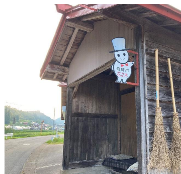
【写真①】 ひだまる桃源郷線 花之木バス停（河合町稲越地内）