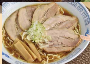
チャーシューメン

地元の事業者さんから地元産の食材・特産品を仕入れながら、神岡ならではの味を楽しんでいただいています。 神岡とんちゃんや飛騨地鶏、ラーメン、地酒など特産品を提供することで、地元のPRに力を入れ、少しでも貢献したいです。