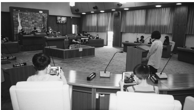
一般質問席で質問する古川小学校児童

これからの飛騨市を担っていく子どもたちに、議会を知るいいきっかけづくりになってもらいたいですね。