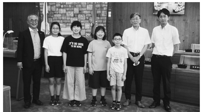
議場を訪れた宮川小学校児童