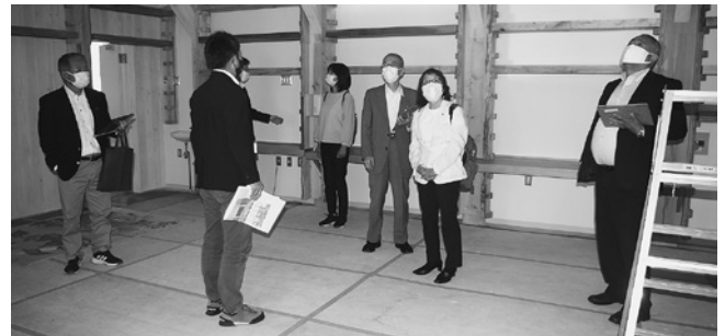
内装工事の上町農産物直売所を視察