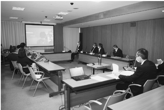
外国人介護職員との対話（オンライン）