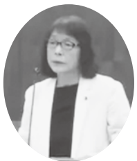
籠山 恵美子 議員