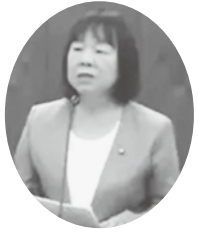
住田 清美 議員