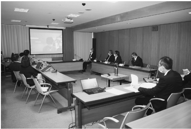
外国人介護職員との対話（オンライン）