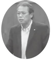
井端 浩二 議員