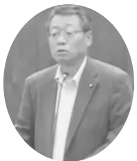
葛谷 寛徳 議員