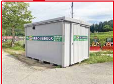
住所：神岡町山田 2358 (旧山田保育園 駐車場)