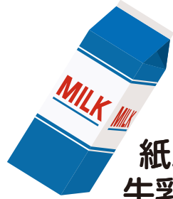
紙パック 牛乳パック