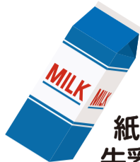
紙パック 牛乳パック