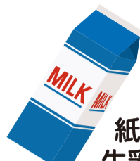
紙パック 牛乳パック