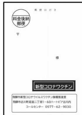
予約案内ハガキの見本