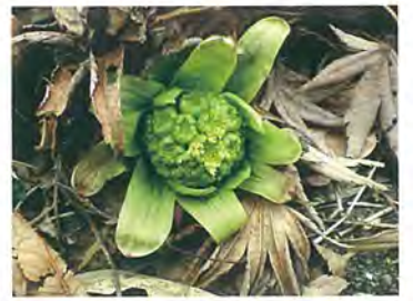
▲成長したフキノトウ