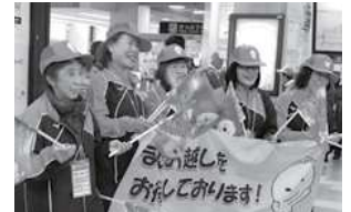
ねんりんピック和歌山大会 駅歓迎の様子

全国から約1万人の選手が集まるねんりんピック。大会の運営を支え、おもてなしの心で温かく選手を歓迎するボランティアに参加してみませんか?