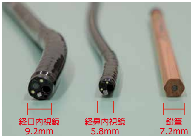
▲経口内視鏡、経鼻内視鏡、鉛筆の比較