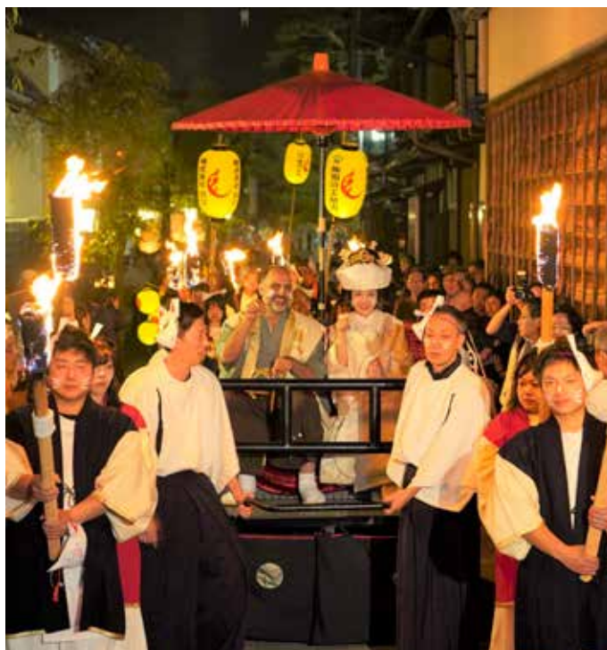
▲市街地を練り歩くきつねの嫁入り行列

民話「きつねの嫁入り」を再現した秋の風物詩「飛騨古川きつね火まつり」が同町のまつり広場をメイン会場に行われました。