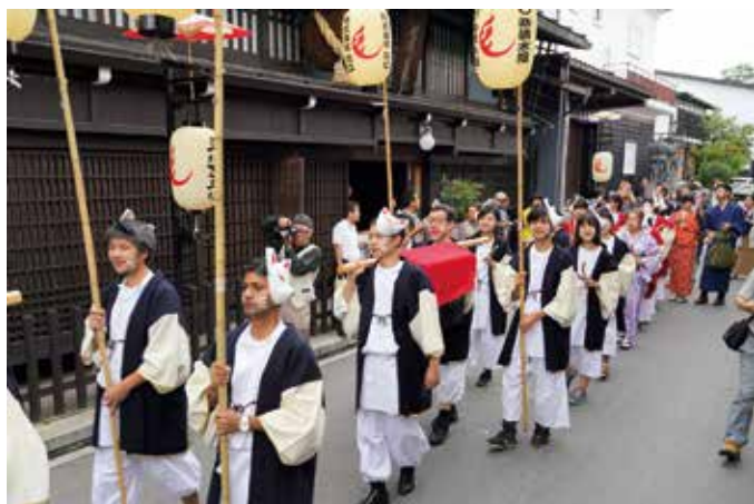
▲ファンクラブ会員の皆さんもまつりを盛り上げました

行列がメイン会場に到着すると、大勢の観客に見守られる中、「結びの儀」が行われ、地元の和太鼓グループ「飛騨古川四神太鼓」の演奏や獅子舞がまつりのクライマックスに華を添えました。