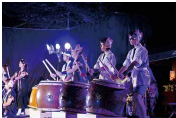
▲迫力ある演奏で会場を盛り上げる『飛騨古川四神太鼓』