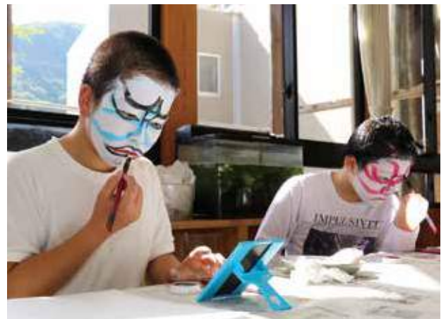
隈取りをする児童

教室では、化粧の講習も行われ、児童は鏡を見ながら自分達の手で顔におしろいを塗り、目や鼻のまわりに赤や青の隈取りを入れました。