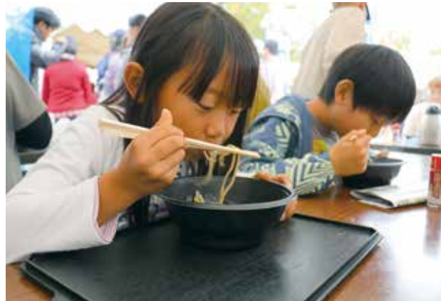
新そばを味わう観光客

この日は、市内にあるそば店と宮川町の万波そばの会、古川町の朝霧そばなど計7団体が参加。市内で栽培されたそばの実を使用し、全て手打ちで提供されました。ざるそばやなめこそばなど、そばの種類も豊富で、訪れた来場者は、新そばの美味しさに舌鼓を打ちました。