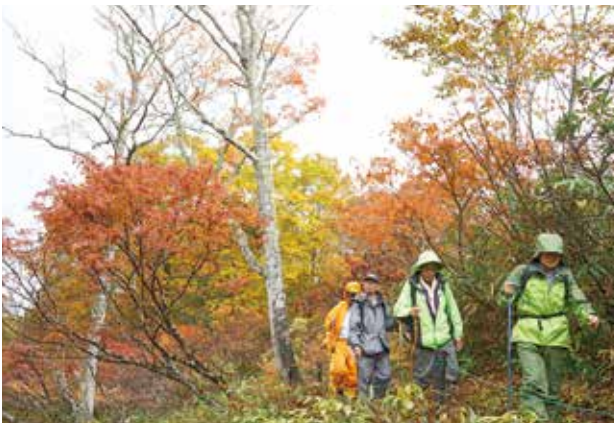
公園内をパトロールする関係者

この日は、各機関の関係者12人が参加し、天生峠から入山。初穂(もみぬか)山を通る班と木平湿原を通る班の2つに分かれてパトロールをし、訪れた観光客へ呼びかけをしました。