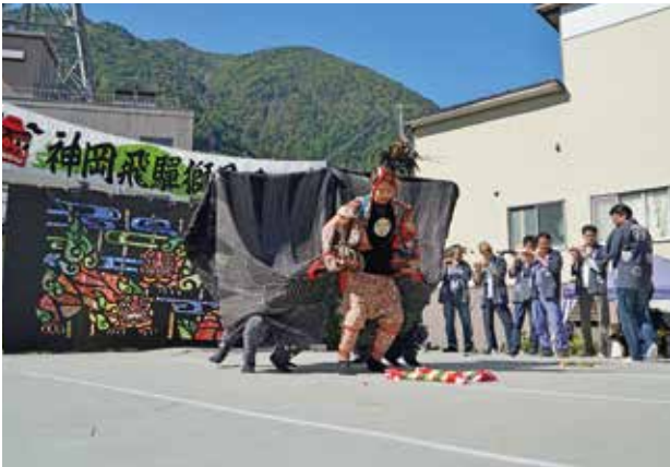
金蔵獅子を披露する下山田若連中の皆さん

バザーでは、神岡名物のとんちゃんをはじめとする飛騨市の特産品に加え、富山市からの海産物やラーメンなどの出店もありました。