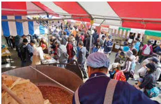
だご汁風やんちゃ鍋とにぎわう会場

また、もちつき体験やレールマウンテンバイクの乗車体験なども行われ、人気を集めていました。