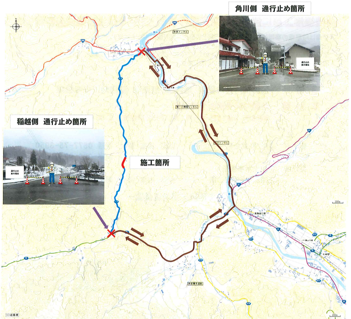
角川側 通行止め箇所