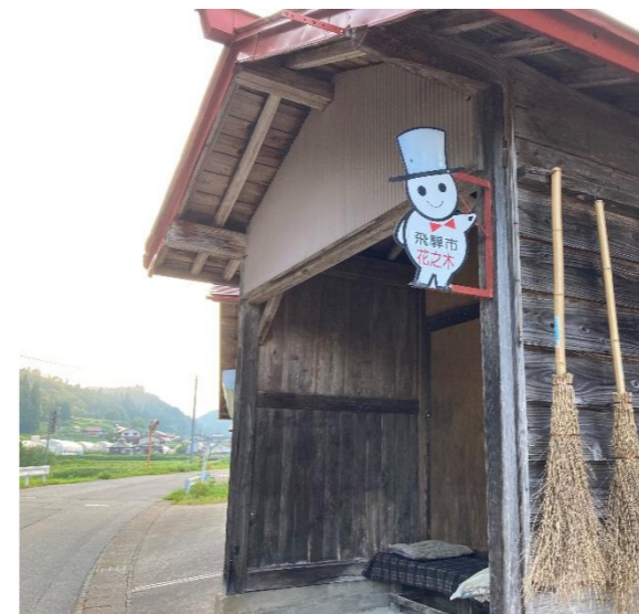
【写真①】 ひだまる桃源郷線 花之木バス停（河合町稲越地内）