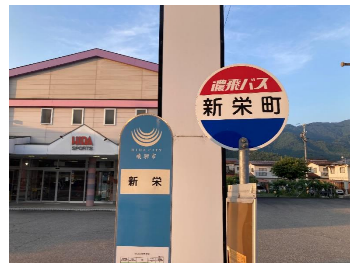
【写真③】 新栄町バス停（古川町栄町地内）