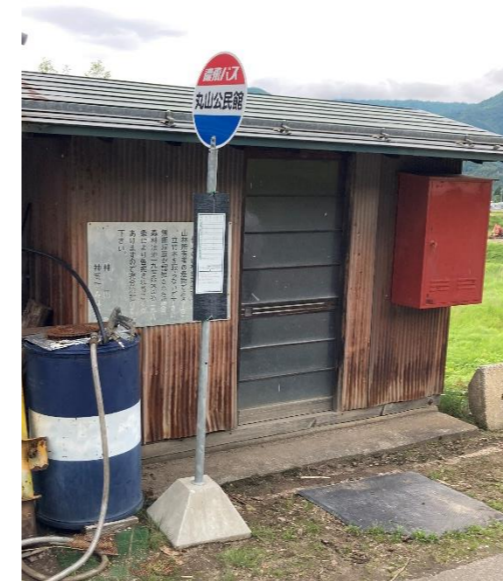
【写真②】 ひだまる吉田線 丸山公民館（神岡町丸山地内）