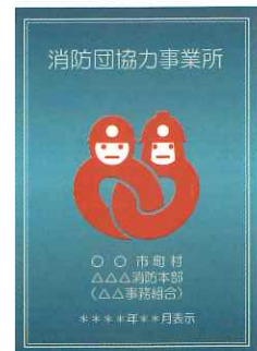
消防団協力事業所表示証

消防団協力事業所表示制度(総務省消防庁ホームページ) https://www.fdma.go.jp/relocation/syobodan/activity/company/