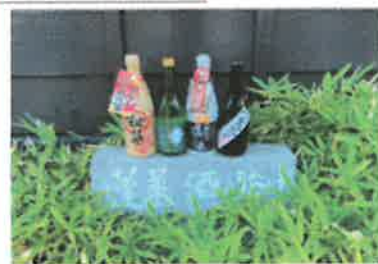
※写真の一部です、どれか一つをお選びいただけます。