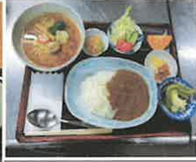
※味処古川:ミニラーメンセット（コーヒー付）