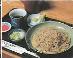
※蕎麦正ななかや:飛騨ざる蕎麦（手打ち）