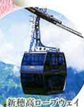
新穂高ロープウェイ