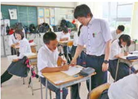
「コミュニケーション英語Ⅱ」の授業