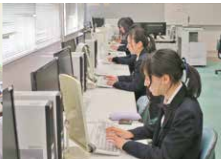
「ビジネス情報」の授業